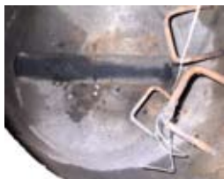
Tætte og vedligeholdte kloakker er den bedste form for rottesikring.

Det vigtigste ved en sikringsordning er imidlertid hverken fælder eller gift men derimod en bygningsgennemgang, der med fokus på fejl og mangler ved bygninger m.v. gør, at rotter og mus ikke trænger ind på virksomhederne.